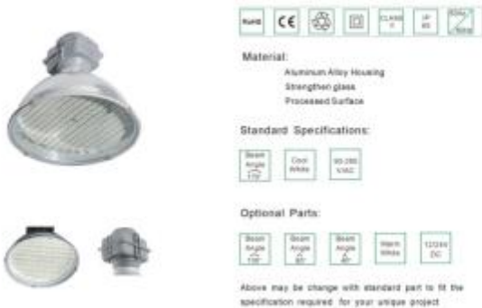
LED HIGH BAY LIGHT

The actual product might vary slightly to photo