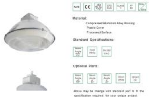
LED HIGH BAY LIGHT

The actual product might vary slightly to photo