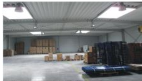
SP-7006, Warehouse, Czech Republic